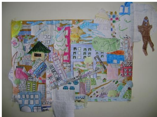
“Trabalho dos alunos do oitavo ano (turma 801) do Colégio Estadual Alcina Rodrigues Lima”

Para isso, inserimos o trabalho no quadro negro, para que esse ficasse visível aos olhos de todos os alunos, já que segundo Fusari e Ferrari (FUSARI, 2001, p.58), “a obra artística só se completa de fato com a participação do espectador”; e estimulamos os alunos a pensarem sobre o trabalho realizado a partir de perguntas simples, como: alguém consegue reconhecer o seu trabalho? A idéia que vocês tinham sobre a natureza a volta de vocês mudou com o acréscimo de outros trabalhos? Vocês gostaram? A natureza é realmente assim? Etc., pois, conforme Camargo (CAMARGO, 1994, p. 12), por ser a educação um processo de desenvolvimento pessoal que não termina com a maturidade biológica, o professor pode e deve se colocar no lugar da criança, compartilhando o seu ponto de vista, sem por isso se tornar pueril.