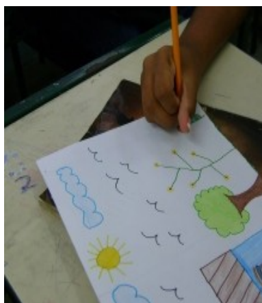
“Desenho sendo elaborado”