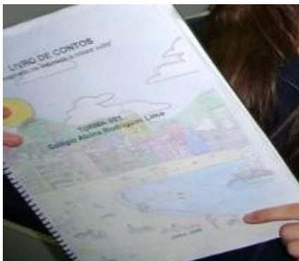
“Livro de conto dos alunos do oitavo ano do Colégio Estadual Alcina Rodrigues Lima”

Com a finalidade de valorizar o trabalho elaborado, levamos os alunos da turma à biblioteca da escola, onde o livro de contos (realizado pela turma) se encontrava.