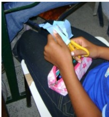
“Recorte dos detalhes”