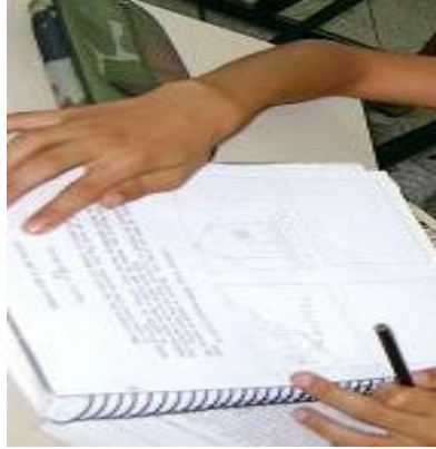
“Leitura e elaboração do desenho”

poderá ser consistente se incluir o “fazer artístico” pessoal e grupal e as elaborações sensíveis e cognitivas frente às próprias produções artísticas e a de outras pessoas.