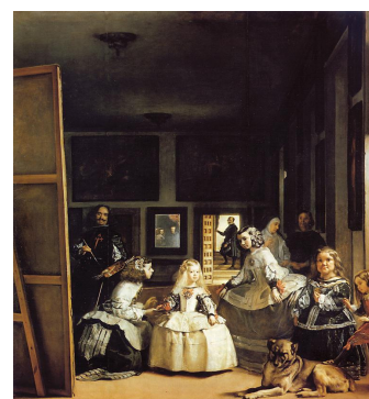
Las Meninas , Velásquez

Claro que essa obra é enigmática e nos caberia buscar entender a noção de perspectiva, noção essa que perpassa toda a história das artes. Bom, o que nos importa aqui não é desvendar o enigma do quadro, mas mostrar que dele se desenvolvem uma série de textos que explicam não apenas a representação da família real como também toda a